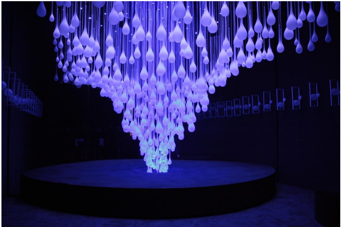
Through Hollow Lands por Etta Lilienthal y Ben Zamora.

El tema de ésta edición cubrió la relación entre el presente y el futuro. Por cambiar la fórmula, la renovación trajo nuevos diseños al Diseño Global. Trajo consigo instalaciones y exhibiciones que reflejan la evolución del diseño en todas sus formas. Un espacio para las principales marcas internacionales y diseñadores famosos con exposiciones sobre el futuro, pero también con el espacio dedicado a la investigación y a jóvenes diseñadores.